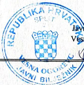
Javni bilježnik Vesna Ogorevc